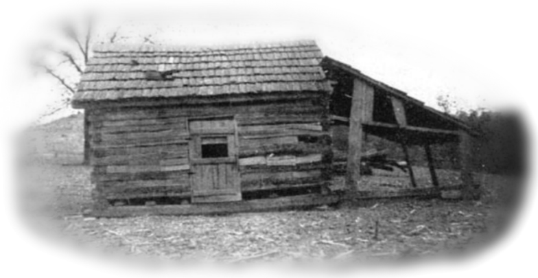
Drevený zrub neďaleko mestečka Burkesville, Kentucky, kde sa 6.apríla 1909 narodil William Branham.